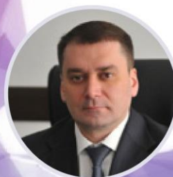
Алексей Гусев Министр торговли и услуг Республики Башкортостан