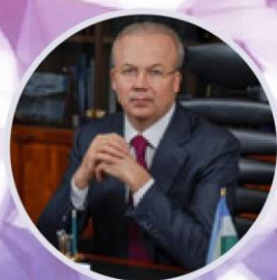
Андрей Назаров Премьер-министр Республики Башкортостан