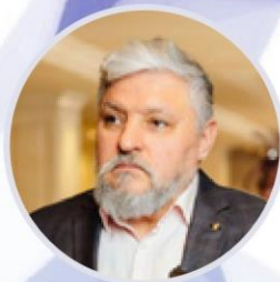
Игорь Бухаров Президент Федерации Рестораторов и Отельеров России