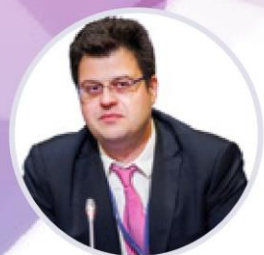
Никита Кузнецов Директор Департамента развития внутренней торговли Минпромторга России