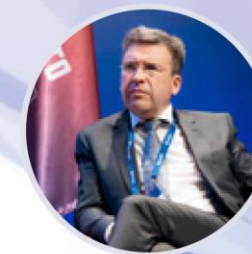
Владлен Максимов Президент Ассоциации малоформатной торговли России