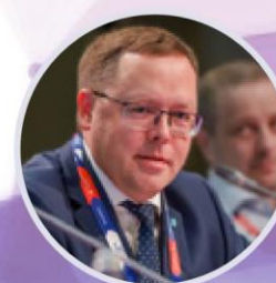
Андрей Карпов Председатель правления Российской Ассоциации экспертов рынка ритейла